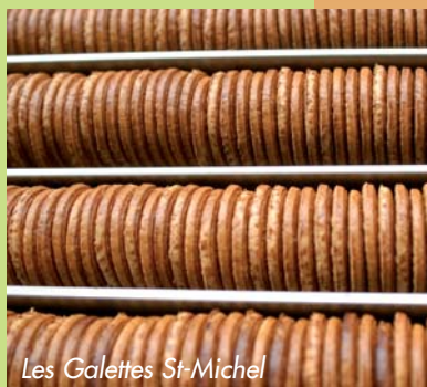
Les Galettes St-Michel

Qui ne connaît pas les fameuses galettes Saint-Michel que petits et grands dégustent depuis des générations ! C'est à Saint-Michel-Chef-Chef que la biscuiterie Saint-Michel les fabrique depuis 1905. Rens. Office de Tourisme de Saint-Michel-Chef-Chef.