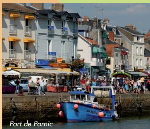
Port de Pornic

c'est à vous de choisir votre destination ! Cap à l'ouest vers la Pointe Saint-Gildas ou cap au nord pour rejoindre Saint-Michel-Chef-Chef et la grande plage de Tharon.