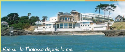
Vue sur la Thalasso depuis la mer

propose, dans un cadre exceptionnel, des séjours de remise en forme sur mesure selon vos besoins. Détente ou tonicité, la mer vous prodigue ses bienfaits, que ce soit pour la journée ou une semaine. Ouvert à l'année 7j/7. Tél. 02 40 82 21 21 - www.thalassopornic.com